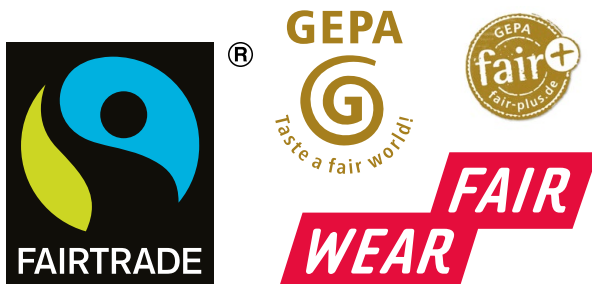
Das Siegel für Fairen Handel

Die wichtigsten Siegel, an denen man fair gehandelte Produkte erkennt: