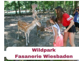
Wildpark Fasanerie Wiesbaden

Der 25 ha große städtische Tier- und Pflanzenpark Fasanerie liegt umgeben von Wiesen, Wäldern und Bächen des Taunus und beheimatet rund 40 europäische Tierarten (etwa 200 Tiere) in großzügigen Freigehegen, die weitgehend den natürlichen Lebensräumen entsprechen.